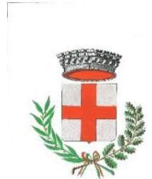
Comune di San Vito di Leguzzano